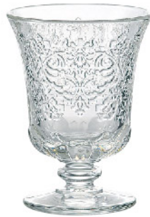
605201 アンボワーズ ゴブレット290cc 寸法/径9×高さ12cm/6入 1,500 円 (税込1,650円)

アンボワーズは、底にアーモンドと棘模様が施された聖杯の形をしており、15世紀に生まれたベネチアガラスからインスパイアされた作品です。ルネサンス時代のアラベスク模様を引き継いだ立体的な花柄がハートを象っています。愛情や魅力、誠実さを連想させるためにハートが選ばれました。