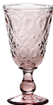
631761 色/アメジスト リヨネ ワイン230cc 寸法/径8.5×高さ16cm/6入 1,800 円 (税込1,980円)