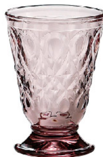
626561 色/アメジスト リヨネ タンブラー200cc 寸法/径8×高さ11.3cm/6入 1,600 円 (税込1,760円)