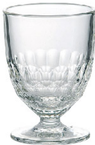
611701 アルトワワイン230cc 寸法/径7.8×高さ11cm/6入 1,400 円 (税込1,540円)