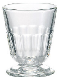
635101 ペリゴール タンブラー230cc 寸法/径8.3×高さ10.5cm/6入 1,400 円 (税込1,540円)

側面をカットしたデザインや丸みのある足元が特徴的なデザインで、ルイ16世時代に登場し広まりました。 ペリゴールはリュウファや美食で知られる地方の名前でもあります。 18世紀のプロー成型の復刻モデルです。