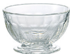
623001 ペリゴール ミニボウル 寸法/径8.5×高さ5.2cm/6入 1,200 円 (税込1,320円)