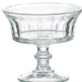
627701 シャンパーニュ ケーブ220cc 寸法/径10.7×高さ10cm/6入 1,200 円 (税込1,320円)