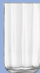
LU-127 12980/01 ロングドリンク 450ml 寸法/径7.2×高さ13.3cm/4入 1,500 円 (税込1,650円)