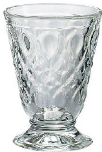
626501 色/クリア リヨネ タンブラー200cc 寸法/径8×高さ11.3cm/6入 1,400 円 (税込1,540円)