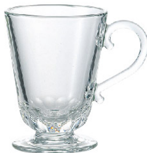
623701 ルイゾン マグ250cc 寸法/径8.3×高さ11cm/6入 1,700 円 (税込1,870円)