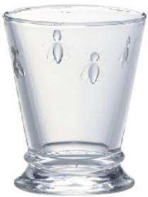
614001 アベユ タンブラー180cc 寸法/径8×高さ10cm/6入 1,300 円 (税込1,430円)