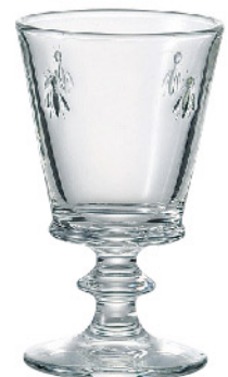
611001 アベユ ワイン240cc 寸法/径8.5×高さ14cm/6入 1,500 円 (税込1,650円)