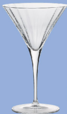
LU-29 10951/01 マティーニ 260ml 寸法/径11.3×高さ18.5cm/4入 2,500 円 (税込2,750円)