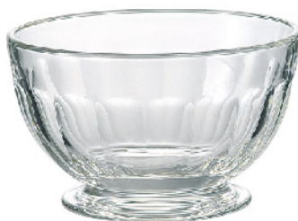
623301 ★数量限定商品★ ペリゴール ボウル 寸法/径13.5×高さ8.2cm/6入 1,300 円 (税込1,430円)