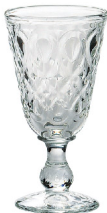
631701 色/クリア リヨネ ワイン230cc 寸法/径8.5×高さ16cm/6入 1,500 円 (税込1,650円)