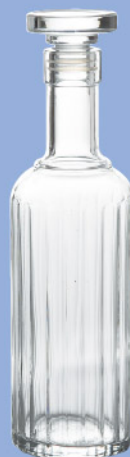
LU-32 11313/04 デカンタ蓋付 700ml 寸法/径8.2×高さ28cm/1入 3,700 円 (税込4,070円)