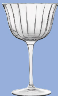
LU-131 12940/02 レトロフィズ 260ml 寸法/9.7×高さ15.7cm/4入 2,000 円 (税込2,200円)