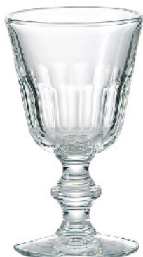
620901 ペリゴール ワイン220cc 寸法/径8.5×高さ14.5cm/6入 1,500 円 (税込1,650円)