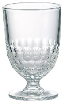
611601 アルトワワイン310cc 寸法/径8×高さ12.5cm/6入 1,500 円 (税込1,650円)