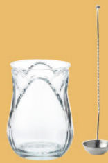
ボウルとレードルの セットです