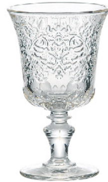
605101 アンボワーズ ワイン260cc 寸法/径9×高さ15cm/6入 1,500 円 (税込1,650円)