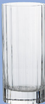
LU-31 10824/01 ビバレッジ 480ml 寸法/径7.2×高さ16cm/6入 1,800 円 (税込1,980円)