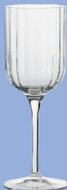
LU-26 11285/01 ホワイトワイン 280ml 寸法/径7×高さ20.6cm/4入 2,000 円 (税込2,200円)