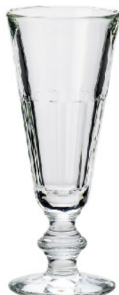
621101 ペリゴール シャンパン160cc 寸法/径6.7×高さ16.8cm/6入 1,500 円 (税込1,650円)