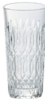
626301 ヴェローヌロングタンブラー360cc 寸法/径7.5×高さ15.4cm/6入 1,500 円 (税込1,650円)