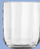
LU-128 12976/01 ウイスキー 350ml 寸法/径7.8×高さ9.2cm/4入 1,000 円 (税込1,100円) ★数量限定商品★

レトロシックがテーマのエlegantなデザイン。クラシックな パースタイルにも違和感のない透明度の高いソニックスクリスタルのライン。