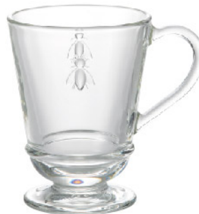
638801 アベユマグ275cc 寸法/径8.5×高さ11.5cm/6入 1,800 円 (税込1,980円)