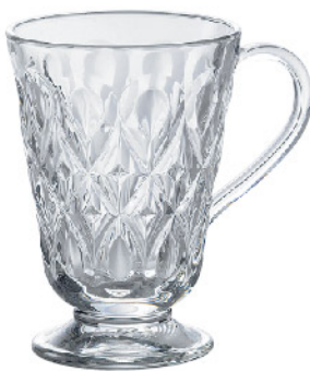
632301 リヨネ マグ260cc 寸法/径8.3×高さ12cm/6入 1,800 円 (税込1,980円)