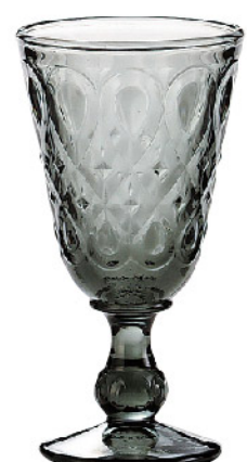
631710 色/グレー リヨネ ワイン230cc 寸法/径8.5×高さ16cm/6入 1,800 円 (税込1,980円)