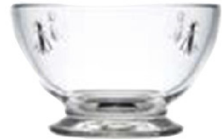
630301 アベユ ボウル 600cc 寸法/径13.5×高さ8.2cm/6入 1,800 円 (税込1,980円)