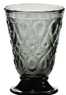
626510 色/グレー リヨネ タンブラー200cc 寸法/径8×高さ11.3cm/6入 1,600 円 (税込1,760円)