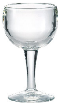
603001 パロン ワイン260cc 寸法/径8.5×高さ15cm/6入 1,500 円 (税込1,650円)