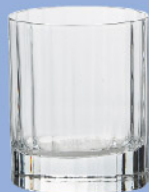
LU-30 10825/01 ウイスキー 255ml 寸法/径7.5×高さ9cm/6入 1,600 円 (税込1,760円)

レトロシックがテーマのエレガントなデザイン。 クラシックな バースタイルにも違和感のない 透明度の高いソニックスクリスタルのライン。