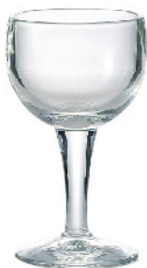
625701 パロン ワイン140cc 寸法/径7.5×高さ13.5cm/6入 1,400 円 (税込1,540円)