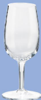
LU-101 10229/01 DOCティスティンググラス120cc 寸法/径5×高さ13.5cm/6入 900 円 (税込990円) ★数量限定商品★