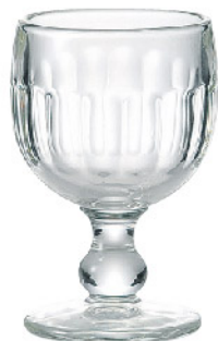
635801 コトー ワイン200cc 寸法/径7.5×高さ12cm/6入 1,400 円 (税込1,540円)