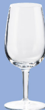
LU-102 10228/01 DOCティスティンググラス215cc 寸法/径6×高さ15.5cm/6入 1,200 円 (税込1,320円)