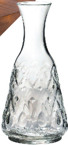
740801 リヨネ カラフェ750cc 寸法/径10.5×高さ23cm/1入 3,400 円 (税込3,740円)

ルネサンス時代、リヨンはイタリアの影響が強くフィレンツェのルネサンス様式が生活日用品に反映されていました。当時のヨーロッパでは既に歴史的価値のある装飾品、美術品の探求や、回顧の趣向があり、リヨネシリーズはそのような時代の中生まれたものです。リヨネシリーズは1890年に制作されたモデルの復刻盤で、モチーフは当時のイタリア王宮の宝石を思い起こさせるようです。