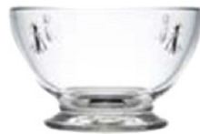
630701 アベユ ミニボウル 270cc 寸法/径8.5×高さ5.2cm/6入 1,300 円 (税込1,430円)

ナポレオンの紋章や襟章、エンブレムに使われた蜂のモチーフ。 マント、家具調度品の皮革や織物、絨毯、旗などにも見受けられます。