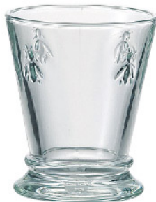
612101 アベユ タンブラー260cc 寸法/径8.5×高さ10.5cm/6入 1,400 円 (税込1,540円)